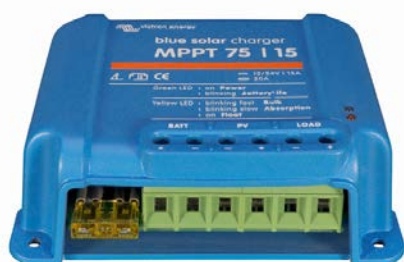
Contrôleur de charge solaire MPPT 75/15